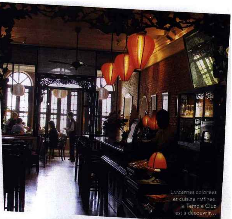
Lanternes colorées et cuisine raffinée... le Temple Club est à découvrir...

Forfait vols A/R Paris-Saigon direct sur Vietnam Airlines, transferts en véhicule climatisé de Hô Chi Minh-Ville à Phan Thiet et 6 nuits à l'hôtel Victoria, dans un bungalow chambre double avec petit déjeuner, à partir de 1 600 euros par personne, hors juillet et août. Comptoir des pays du Mékong: 0.892.231.251. www.comptoir.fr et www.vietnamairlines.com